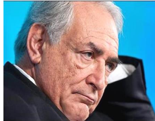
Ντομνίκ Στρος Καν