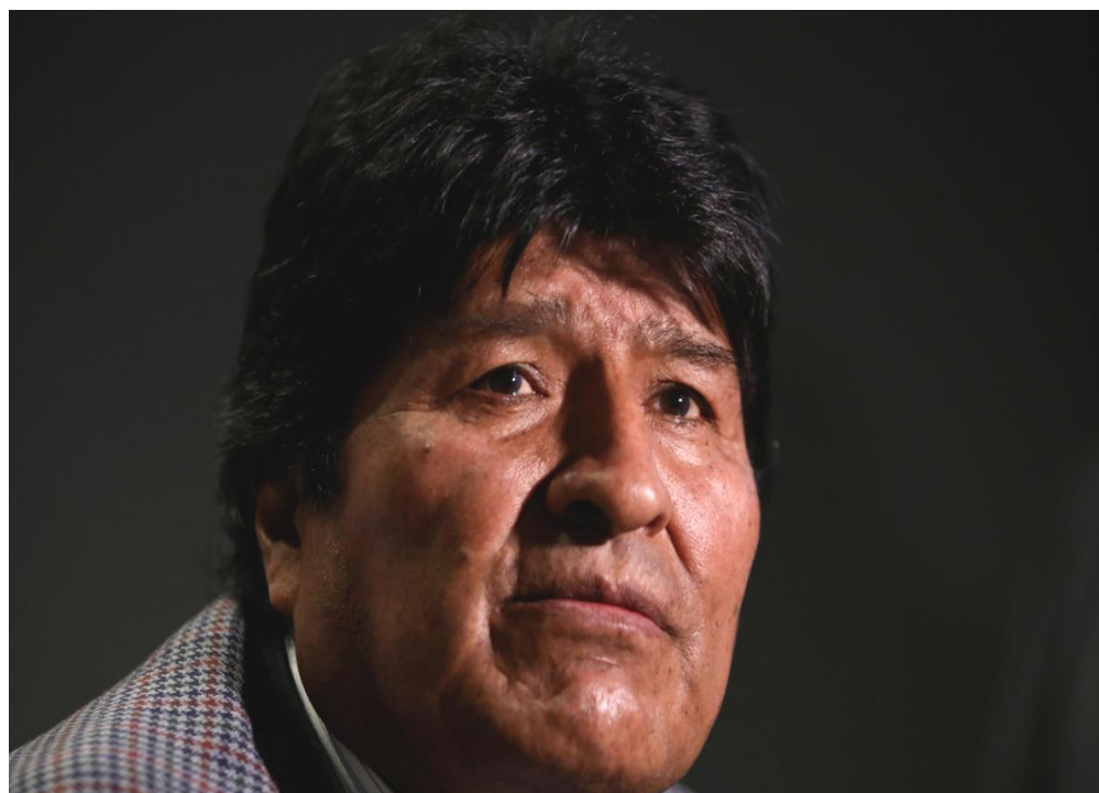
Το ζωηρό παλιόπαιδο των Άνδρων και φίλος του Τσίπρα

Το αδίκημα που βάραινε τον φίλο του Τσίπρα ήταν η κακοποίηση (βιασμός) 15χρονης το 2015 ενώ ήταν πρόεδρος της Βολιβίας και ότι απέκτησε παιδί μαζί της. Λίγο αργότερα ο Μοράλες έγινε πρωταγωνιστής σε μια συμπλοκή με την Αστυνομία όταν η ειδική μονάδα δίωξης των ναρκωτικών FELCN σε μια συνηθισμένη περιπολία της σε αυτοκινητόδρομο ζήτησε από μια αυτοκινητοπομπή να